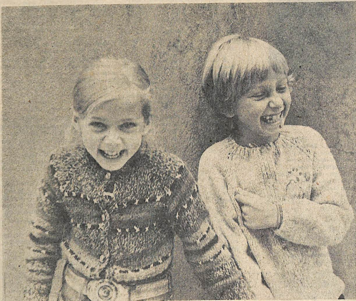
Из коллекции НФС «Образ». «Смешинка».